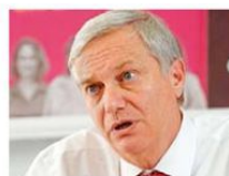
El ex candidato José Antonio Kast.