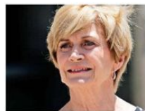
La alcaldesa Evelyn Matthei.

En cuanto a Kast, destaca varios puntos. Uno es que recientemente fue candidato, logrando 28% en primera vuelta. "Ese es su voto duro y ha tendido a mantenerlo". Lo otro, acota, es que mientras la derecha